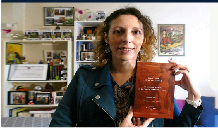
A la rencontre d'une auteure et d'une dompteuse de tigres