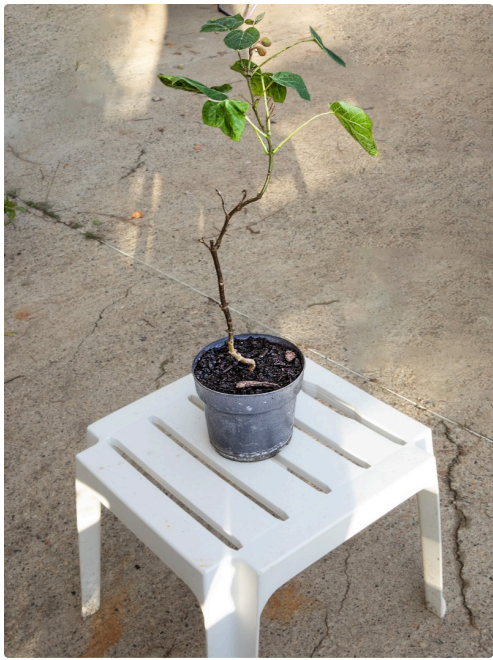
Jeune paulownia en pot qui va être planté par Victorien Soules