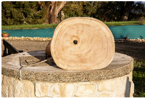
Tranche d'un paulownia de 9 ans