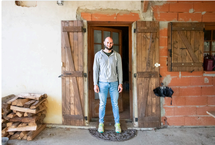
Sauboires (Manciet): arbre magique, le paulownia va-t-il remplacer le peuplier?

Un arbre à croissance rapide, anti-pollution, léger, résistant, très peu inflammable etc.: il a presque toutes les qualités