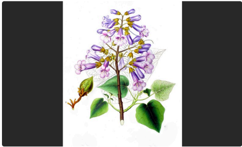
Fleurs du paulownia