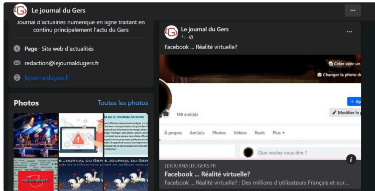
Des millions d'utilisateurs français et européens ne peuvent plus avoir accès à leur compte...

Pourtant on le savait depuis longtemps: FB est une entreprise commerciale, rien de plus.