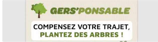
Gers'ponsible, la compensation carbone locale 100% Gers

Le nouveau dispositif de compensation carbone du tourisme qui contribue à la préservation des paysages gersois et de sa biodiversité.