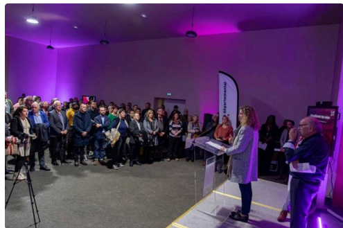
L'assistance nombreuse attentive