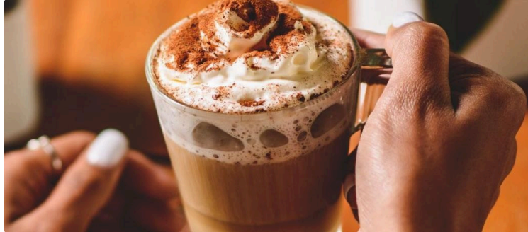
Vic Accueil : des nouveautés en novembre !

Au mois de novembre, le centre social Vic Accueil vous propose un programme riche et varié.