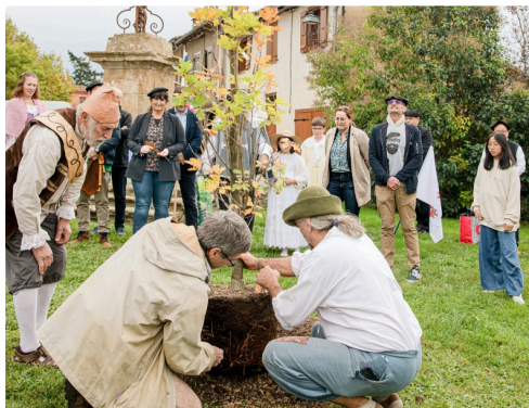
Le chêne est placé dans son trou