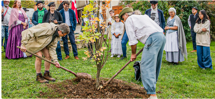
Un chêne planté à Lupiac fera penser à d'Artagnan, mort il y a 350 ans

Au pied du chêne, une plaque gravée en français et en 2 versions de gascon le fera connaître