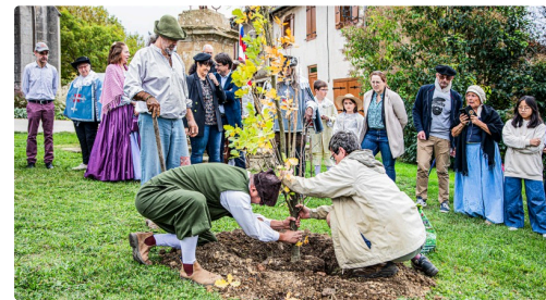
Le chêne est planté