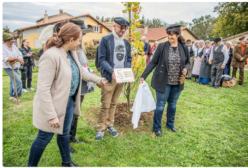
Dévoilement de la plaque