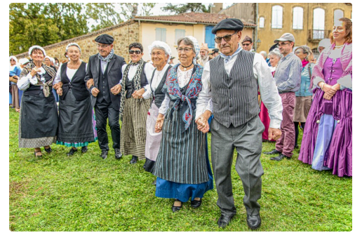
Le Rondeau de Margouët en action