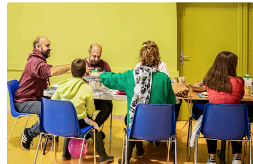
La collation après le don