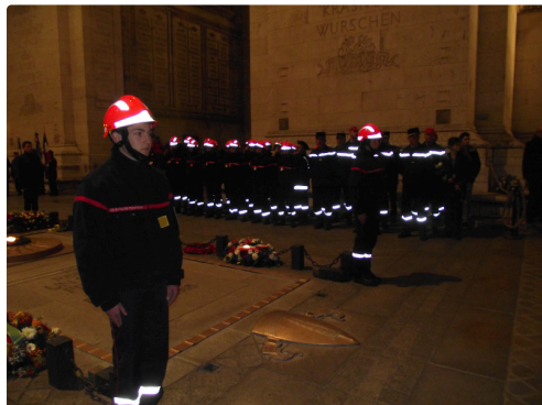
Les 20 jeunes sapeurs pompiers au garde-à-vous lors du ravivage de la flamme.

Des souvenirs plein les yeux pour ces jeunes volontaires.