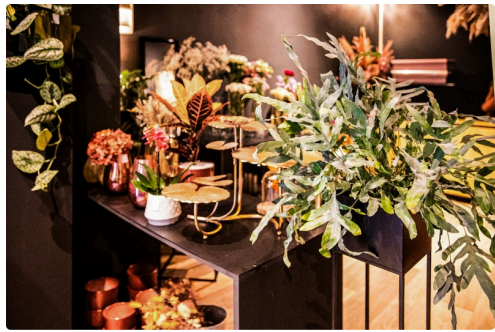
Plantes, vases et objets de décoration