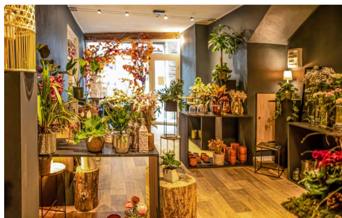
Le magasin vu du fond