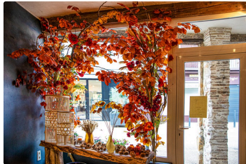
La vitrine vue de l'intérieur