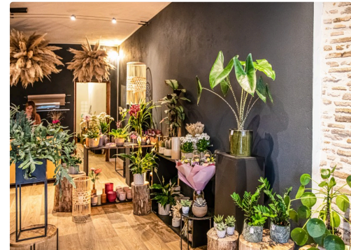
Le magasin vu de l'entrée