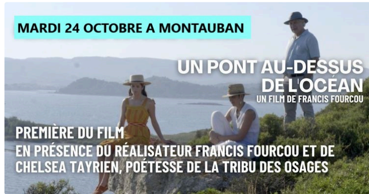
Un pont au dessus de l'océan en avant-première à Montauban