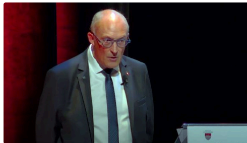
condom maire mi mandat 54.JPG