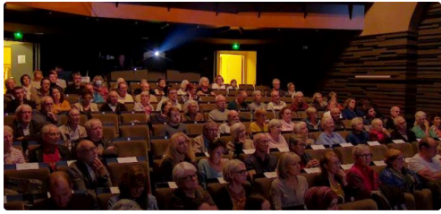
condom salle maire mi mandat.JPG