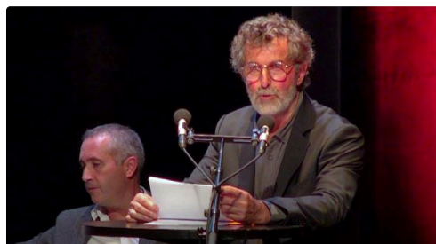
condom maire mi mandat 285.JPG