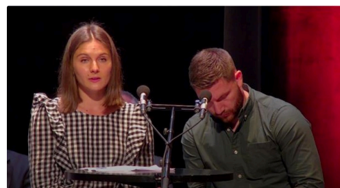
condom maire mi mandat 534.JPG