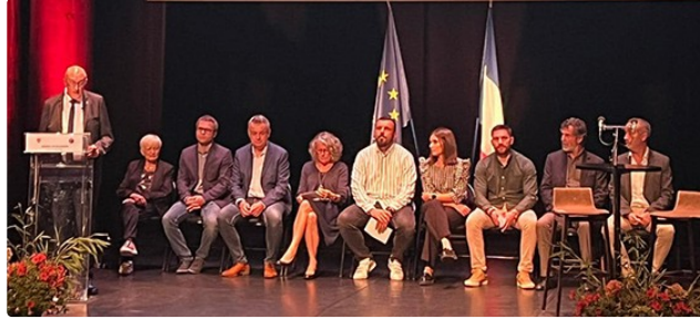
Le bilan du conseil municipal à mi mandat

Un vaste tour d'horizon dans tous les domaines