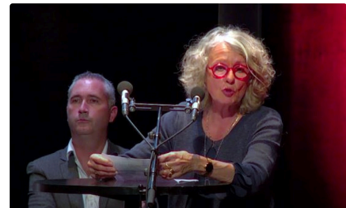
condom maire mi mandat 564.JPG