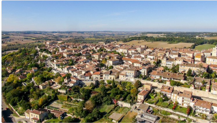
10e édition du Festival « Bizarre, vous avez dit Bizarre ? »

La 10e édition du Festival « Bizarre, vous avez dit Bizarre ? » à Lectoure, un festival pluriartistique, aura lieu du 27 au 30 octobre 2023