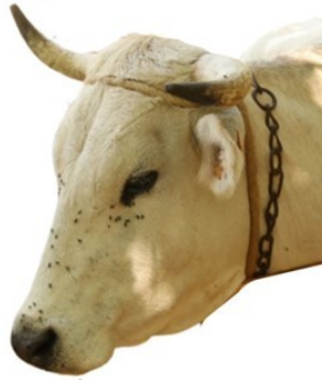
Dimenjada occitana 42/23