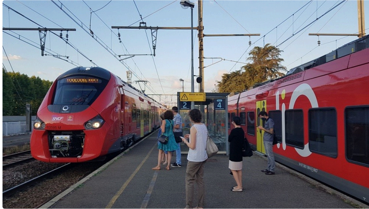
Train à 1€ : un nouveau record de fréquentation

134 000 voyageurs pour ce premier week-end d'octobre !