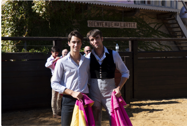
Une belle fin de temporada au Lartet

Ce samedi 7 octobre, plus de 180 personnes ont participé à la fête du Lartet qui signe la fin de la temporada 2023.