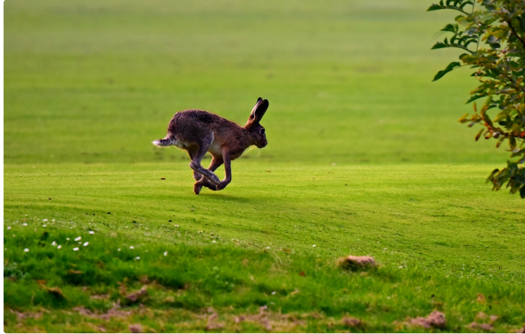
Un dimanche à la chasse à Aux-Aussat

Dimanche 29 octobre 2023, la Fédération départementale des chasseurs du Gers organise l'opération « Un dimanche à la chasse » à destination du grand public.