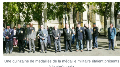
Une quinzaine de médaillés de la médaille militaire étaient présents à la cérémonie.