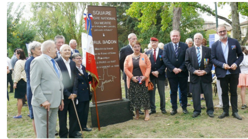
De nombreux bénéficiaires de l'Ordre national du Mérite étaient présents.