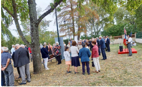
De nombreuses personnes ont assisté à la cérémonie.