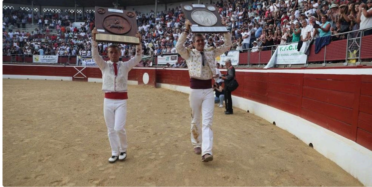
Championnat de France : la course landaise a le vent en poupe

C'est jour de fête dans ce petit village des Landes, jour de course landaise.