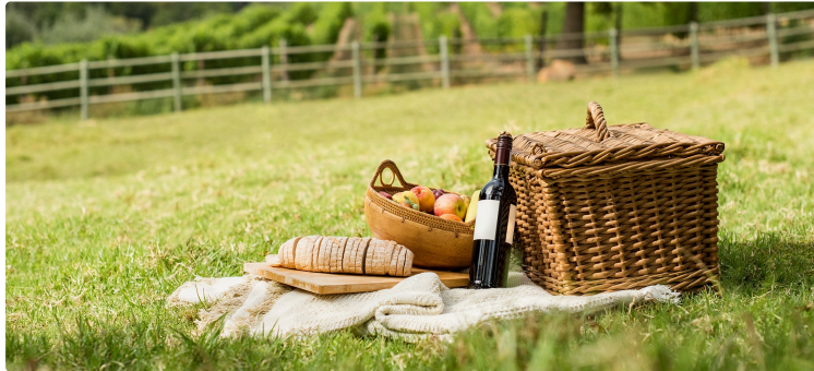
Samedi 21 octobre: randonnée guidée dans le vignoble du Madiran et du Pacherenc

Découvrir les paysages superbes, comme les vignes et les vins