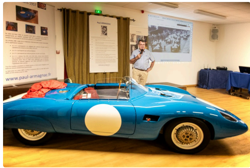
La DB de profil