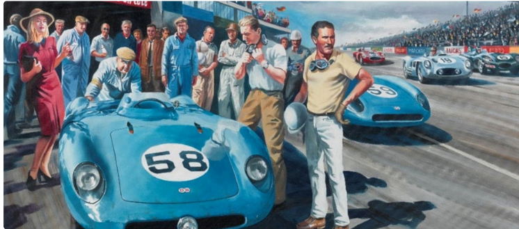
Un site riche et fouillé en l'honneur du champion Paul Armagnac inauguré à Nogaro

Il dit tout sur «le plus grand champion gascon»