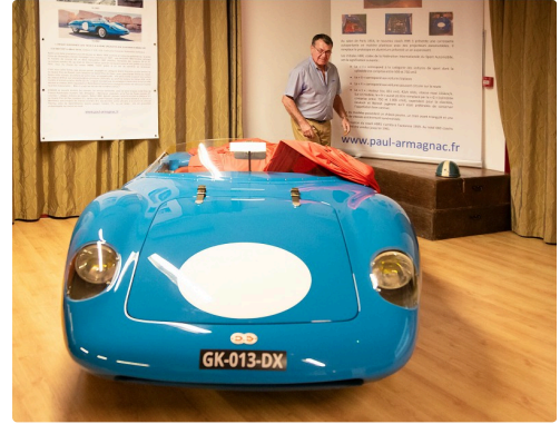
Dévoilement de la DB