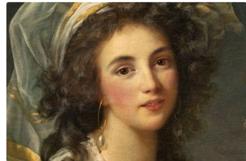
Olympe de Gouges