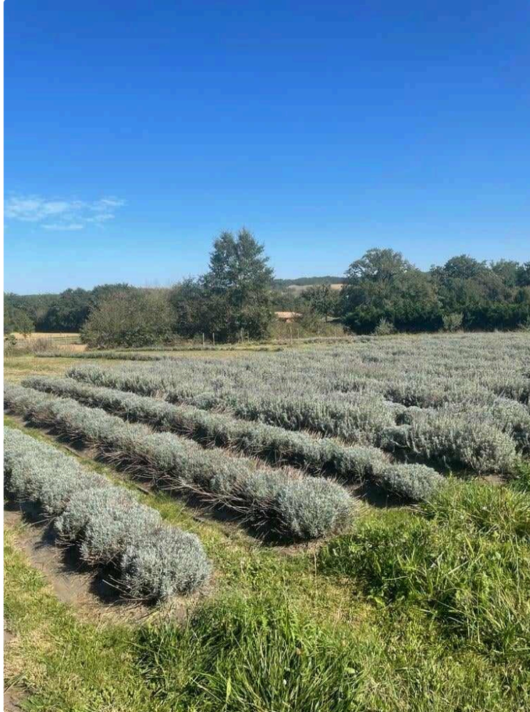
Les jardiniers des jardins familiaux en visite au Domaine d'Elusa

Samedi dernier, les jardiniers des jardins familiaux vicois se sont rendus au Domaine d'Elusa.