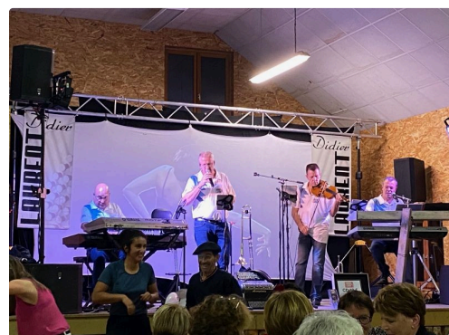
Cazaux Frechet 3.jpg