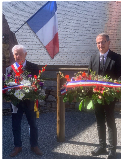
Cazaux Frechet 4.jpg

Cazaux Fréchet Anéran Camors, dans les Hautes Pyrénées, exposée à un climat de montagne, elle est drainée par la Neste du Louron, à une altitude qui s'étage entre 900 et 2173 mètres. En 1806, Cazaux est réuni à Fréchet, sous le nom de Cazaux-Fréchet, de même que Anéran et Camors et sous le nom d'Anéran-Camors. En 1978, Cazaux-Fréchet et Anéran-Camors sont réunis sous le nom de Cazaux-Fréchet-Anéran-Camors. 60 habitants peuplent la commune.