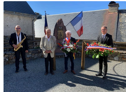
Cazaux Frechet 5.jpg