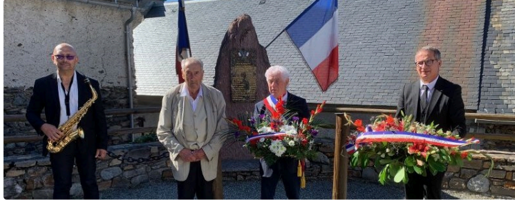
Une amitié bien installée

Lamothe Goas / Cazaux Fréchet Anéran Camor