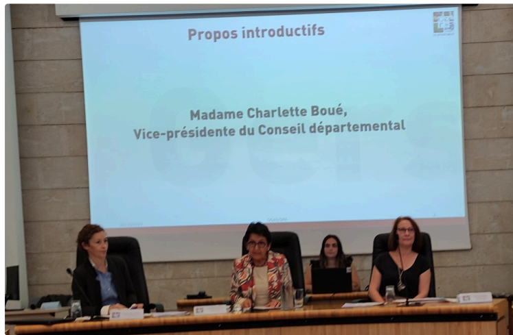
Un Forum, au Conseil Départemental pour présenter les outils de soutien en faveur des aidants

Une assistance nombreuse provenant de tout le département et de différents organismes ou associations a participé avec intérêt au Forum des Aidants ce vendredi 6 octobre, dans l'hémicycle du Conseil Départemental