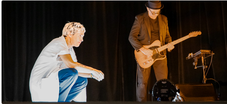
À Nogaro, un superbe spectacle «Ce qu'il en coûte» d'être infirmière

Une mise en avant d'un métier dont le quotidien est peu connu