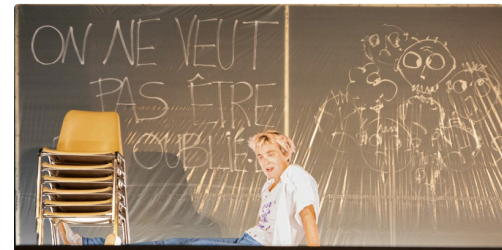
Image finale: soignants et patients ne veulent pas qu'on les oublie