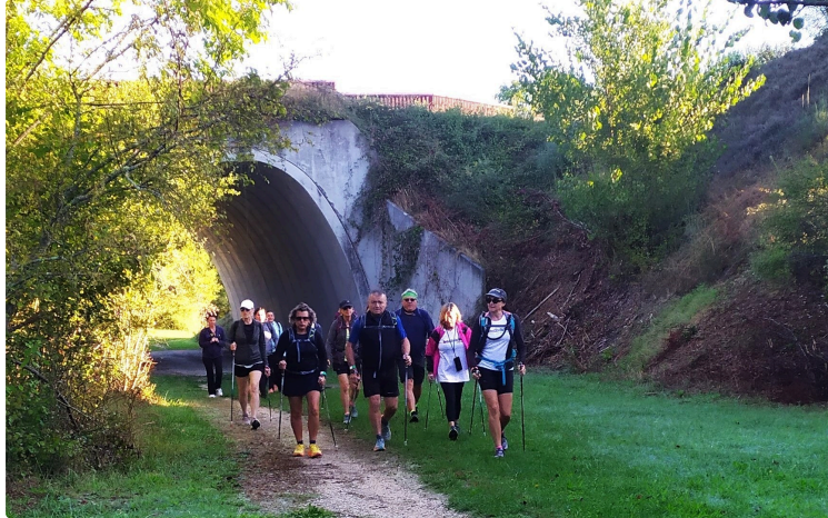
Le "32 du 32" a réuni avec bonheur des sportifs aguerris et des randonneurs au rythme plus raisonnable