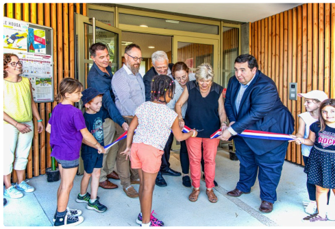
Le ruban est coupé !