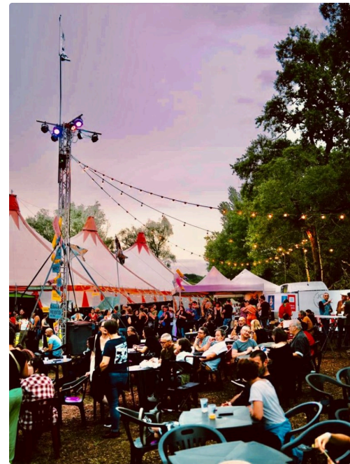
A l'extérieur du chapiteau les spectateurs flânent et se restaurent