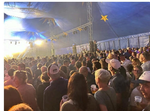
A l'intérieur du chapiteau la communion avec les rockers