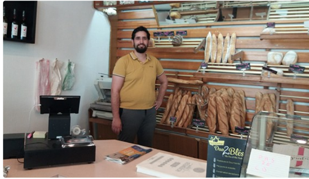
Clap de fin pour la Boulange, Bienvenue à La Mie Flovin