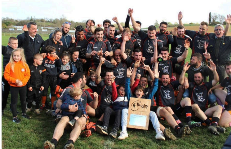
Rugbitalia : UAV Rugby, des prairies champêtres au stade de Goulin...

Dans le cadre de la coupe du monde de rugby, l'association Fogolâr Furlan Vuascogne en partenariat avec l'Union Athlétique Vicoise Rugby organise une belle journée le vendredi 6 octobre, jour de France Italie.