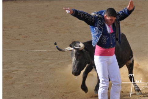
La ganaderia Aiguillon dans les arènes vicoises dimanche !

A l'occasion des fêtes de la Saint Matthieu, les arènes Joseph Fourniol accueilleront une course landaise et des jeux taurins dimanche 17 septembre à 17 h