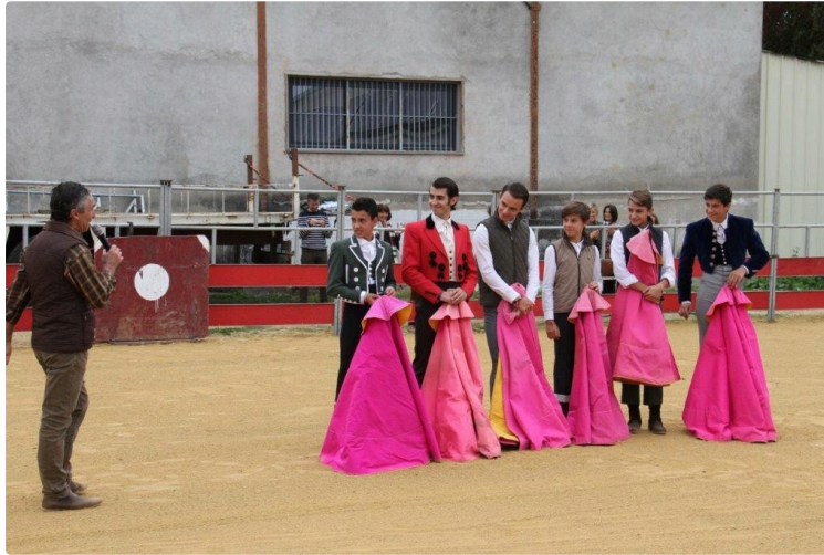
Retour de la capea de la Pena Peleon

Après 3 années d'absence, la capéa de la Peña Peleòn est de retour