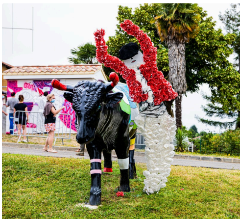
Vache et mannequin écarteur au Houga