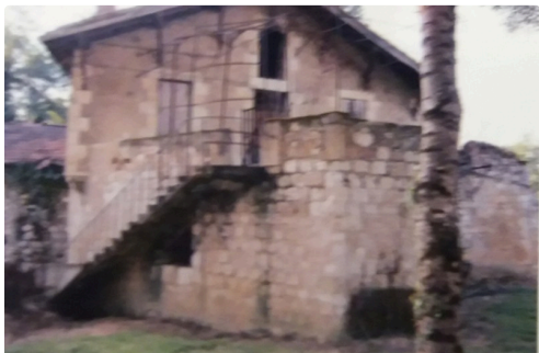
base médiévale du bâtiment du moulin-usine dit "de Barlet" - Beaucaire/Baïse