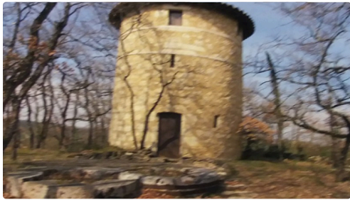
le moulin de Vernon ou de Sonnard