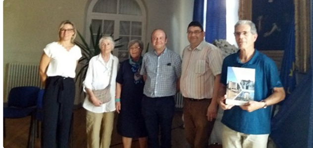
Une belle histoire de Moulins