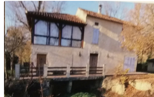
- le moulin de Doat