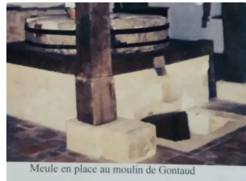
Meule en place au moulin de Gontaud