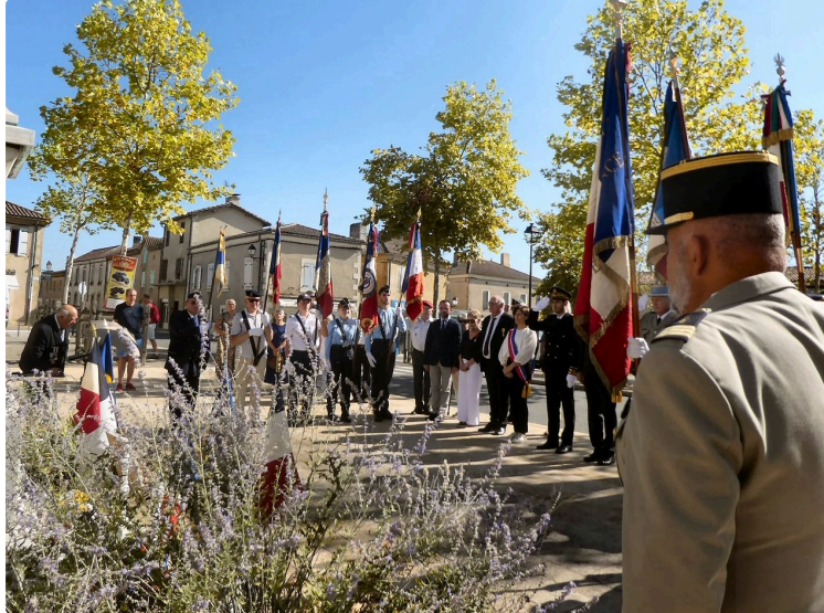
Le massacre de la Sidi-Brahim , commémoré par les Chasseurs de tous les régiments

Depuis plusieurs années, c'est au pied du monument de la place Carnot que les Chasseurs du Gers rendent hommage aux 8 officiers et 252 sous-officiers, clairons, caporaux et chasseurs qui sont tombés le 26 septembre 1845, au Maroc, dans la province d'Oran ,après une résistance de trois jours face aux troupes de l'Emir Abd El Kader , laissant seulement 16 survivants . Ce massacre, dont chaque épisode a été rappelé au début de la commémoration, étant devenu le symbole de la détermination et de l'esprit de sacrifice des Chasseurs, « faire la Sidi Brahim » est devenu pour eux une commémoration incontournable avec notamment la présence du colonel DMD ( Directeur Militaire du Département) et de Mr le sous-préfet de Mirande .