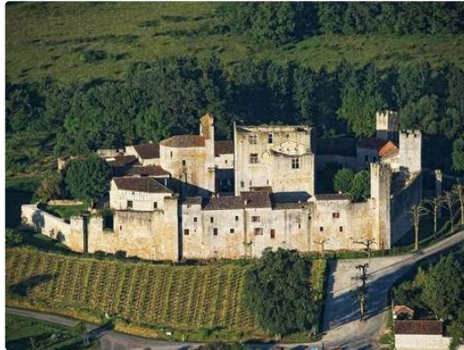
Les Journées Européennes du Patrimoine avec l'Office de Tourisme de la Ténarèze

A l'occasion de la 40ème édition des Journées Européennes du Patrimoine, voici les animations organisées par l'Office de Tourisme de la Ténarèze :