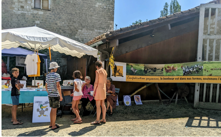
Le Festi'ferme de la Confédération paysanne : une fête paysanne à la ferme Guillot à Saint-Arailles le 17 septembre!

L'évènement traditionnellement organisé lors du premier week-end d'août a été déplacé après les vacances d'été dans l'espoir de pouvoir réunir davantage de citoyen.ne.s et de paysan.ne.s lors de cette journée militante et festive.