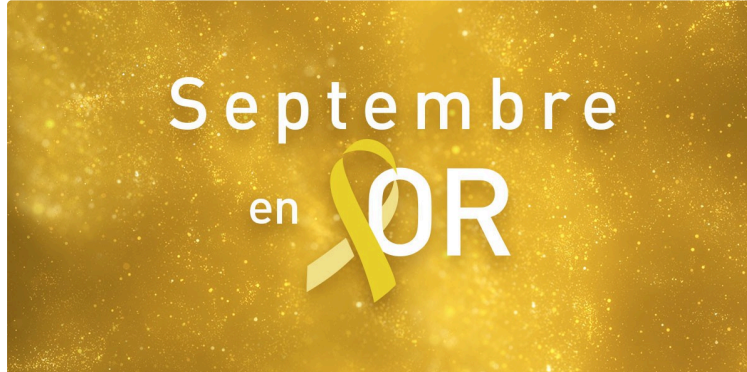
Septembre en Or - Mois international de lutte contre les cancers pédiatriques

La Ligue contre le cancer engagée pour la lutte contre les cancers des moins de 20 ans (nourrisson, enfant et jeune adulte)