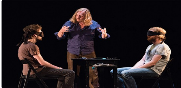
Théâtre des carmes : Sous le charme de la magie et du théâtre

A noter sur vos agendas : le vendredi 15 septembre, la compagnie Rode Boom proposera « Evidences Inconnues, à 20h30, au théâtre des Carmes. venez plonger dans un étrange mélange de genres : mentalisme, théâtre et musique.