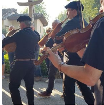
Lecture : Trois jours de fête avec les Gasconnades.

Dans quelques jours, la 9ème édition des Gasconnades se tiendra à Lecture.