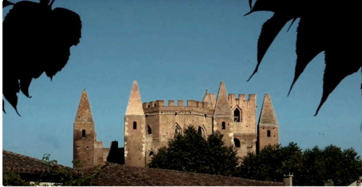
Festival Musique du Gers - saison 2023

Cette année encore, les musiciens de Musique dans le Gers vous proposent des moments de qualité à Simorre et Bellegarde.