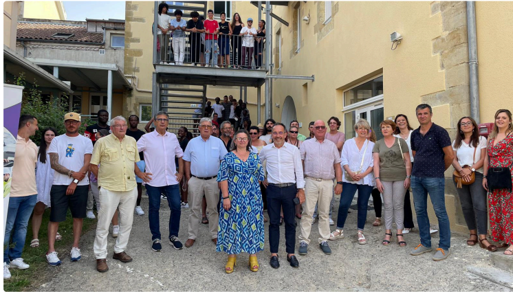
Bilan par 4 Saisons du Houga de la 3e année de Jobs in Jers pour étudiants fauchés