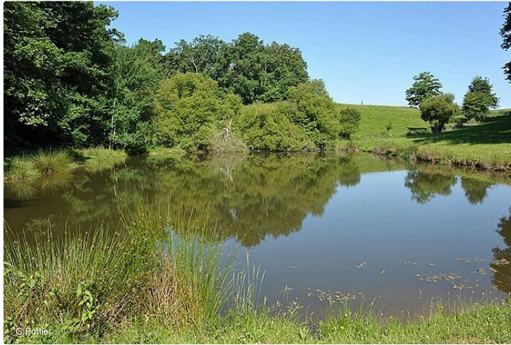
Découvrez l'Adour autrement !

Comme tous les mercredis de l'été, La Maison de l'Eau à Jû-Belloc vous propose de découvrir l'Adour en canoë-kayak mercredi 16 août de 9h à 12h30 ou de 13h30 à 16h30