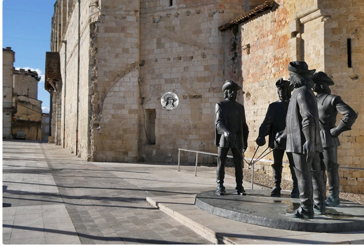
Un personnage célèbre qui restera inoubliable jusqu'à la nuit des temps...

" L'association Chemins d'Art en Armagnac a demandé à l'artiste occitan Louis Viel de proposer une œuvre à l'occasion du 350ème anniversaire de la mort du célèbre et immortel d'Artagnan, né à quelques kilomètres de Condom. L'association condomoise CAA a pour rôle d'associer Art contemporain et patrimoine avec des œuvres réparties dans le territoire.