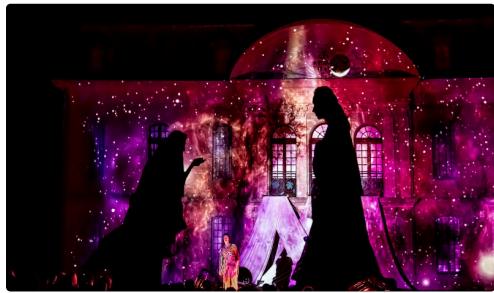
Dionysos écoute les dieux