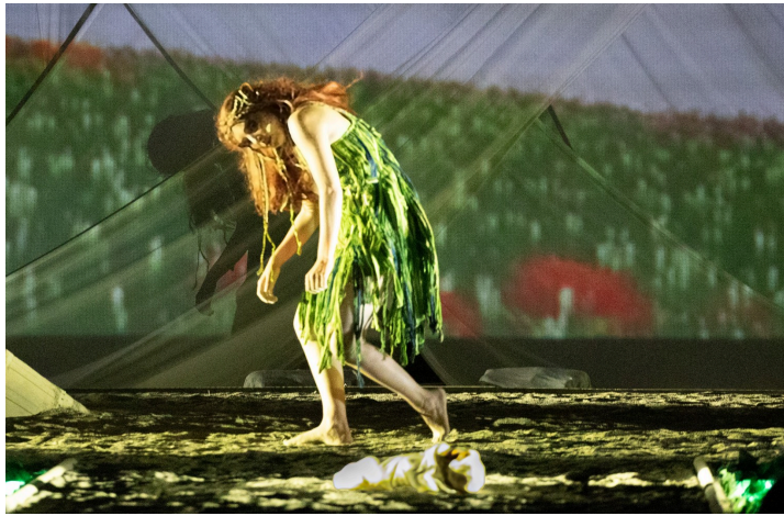
La nymphe remarque le bébé

Zeus prend le fœtus, s'ouvre la cuisse et l'y enferme.