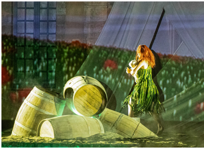
La nymphe recueille Dionysos bébé

Il découvrira son véritable rôle, lorsque la vérité sur ses origines le guidera de l'Olympe aux Enfers. Mais il provoquera la révolte des dieux en dérobant le nectar sacré avec l'ambition de l'offrir aux hommes.