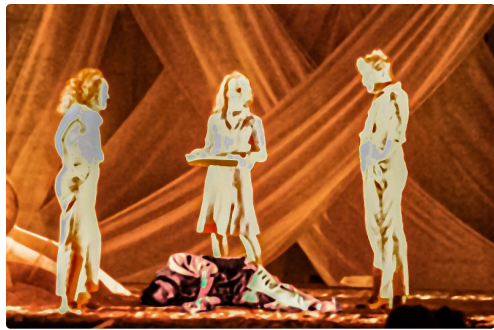
Les dieux discutent du sort de Dionysos