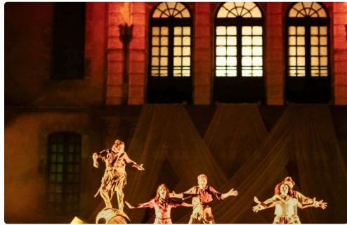
C'est la joie !