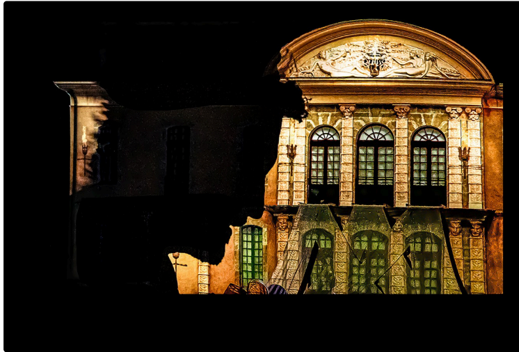
Spectacle grandiose lors des Nuits impériales au château Montus

Les Nuits impériales du château Montus (Castelnau-Rivière Basse) sont des spectacles grandioses et magnifiques, en véritable son et lumière sur la façade du château Montus, classé aux Monuments historiques.