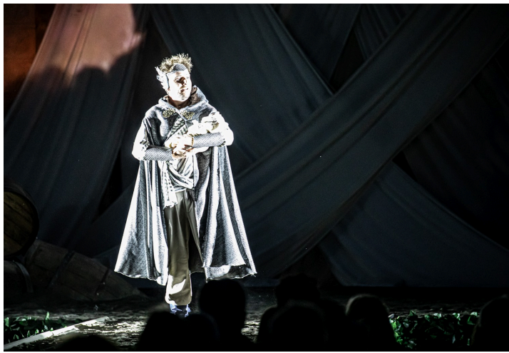
Dionysos bébé est recueilli