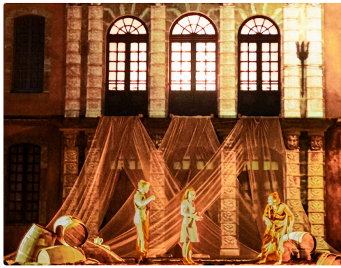
Dionysos discute avec les dieux