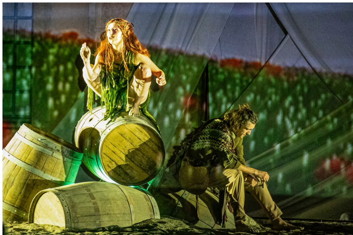
Dionysos s'apprête à partir

Son parcours sera initiatique, sensible et percutant, drôle et émouvant, afin que soit finalement révélé son véritable rôle, loin des théâtres et des lumières de l'Olympe, mais sur une terre fertile et patiente, prête à murmurer les secrets d'un grand vin à l'oreille de celui qui saura l'écouter... »