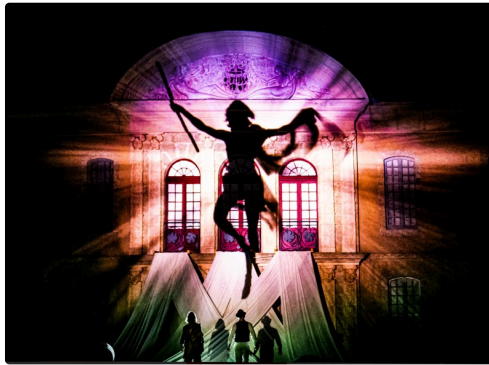
Dionysos apparaît en majesté