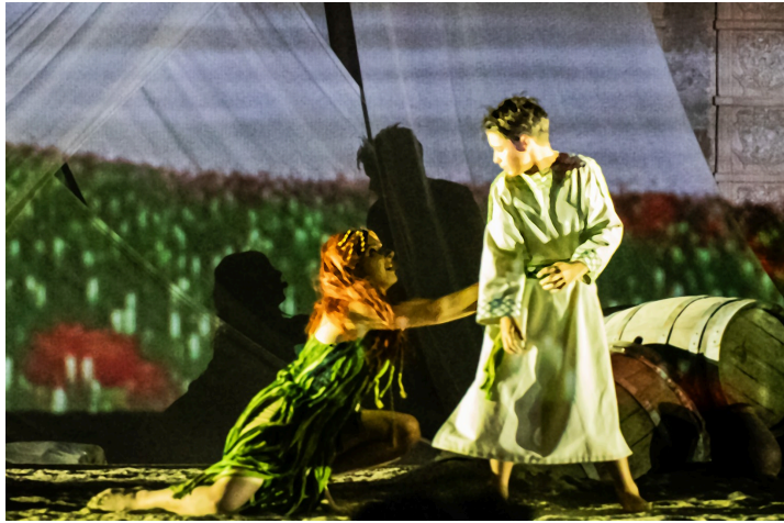
Dionysos devenu grand envisage de quitter la nymphe

Il découvrira son véritable rôle, lorsque la vérité sur ses origines le guidera de l'Olympe aux Enfers. Mais il provoquera la révolte des dieux en dérobant le nectar sacré avec l'ambition de l'offrir aux hommes.