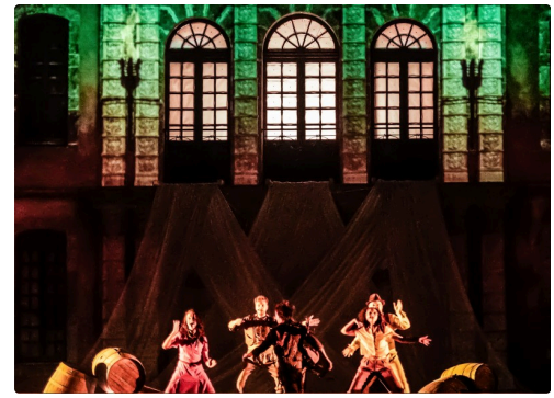
Accueil par les dieux : Zeus déguisé (avec chapeau)