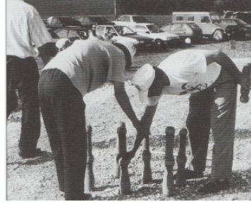
Fêtes de village : et si on revenait aux jeux d'antan?

Quand on lit la presse locale en ce moment, on peut être surpris par le phénomène des fêtes de village : le moindre petit village a sa fête, qu'il s'agisse de vénérer un saint Pierre, Joseph ou André ou de fêter tel ou tel événement.