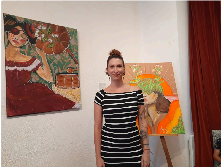
Lola Montes s'expose à l'Atelier 122.

Entre Cabaret et Kahlo, une explosion de couleurs!