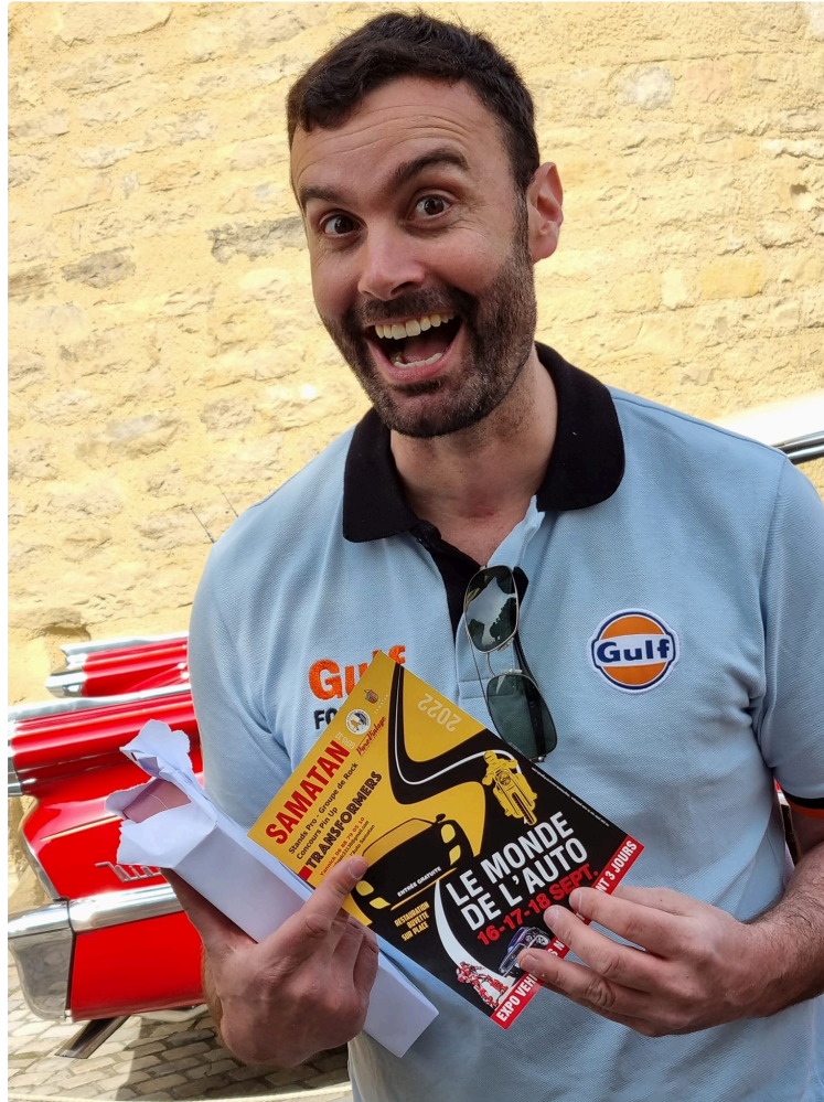
L' American and Classic day revient pour sa 3eme édition !

Dimanche 17 septembre , c'est un grand événement qui revient à Samatan pour la troisième année, pour fêter comme il se doit, les 70ans de la Corvette: l' American and Classic day !